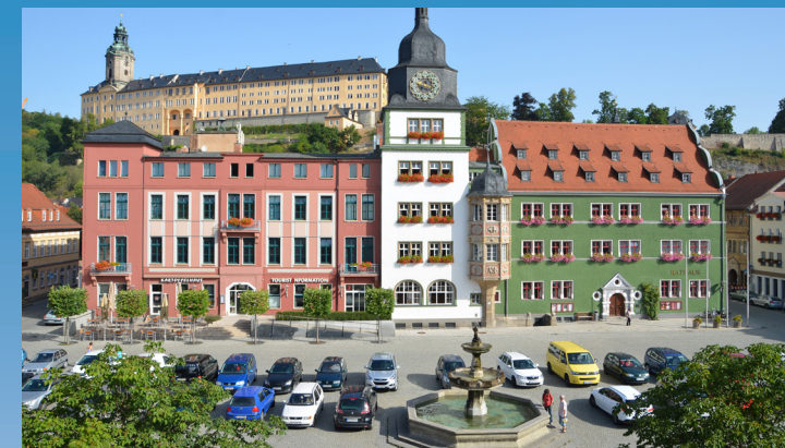
Löwensaal im Rathaus Rudolstadt

Donnerstag 21. November 2019 in Rudolstadt